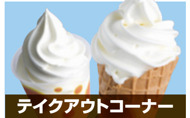
テイクアウトコーナー